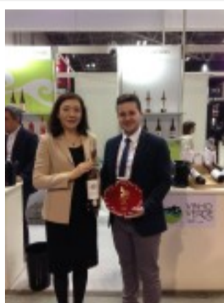
Sakura Diamond Trophy Award at the Wine & Gourmet Fair in Tokyo